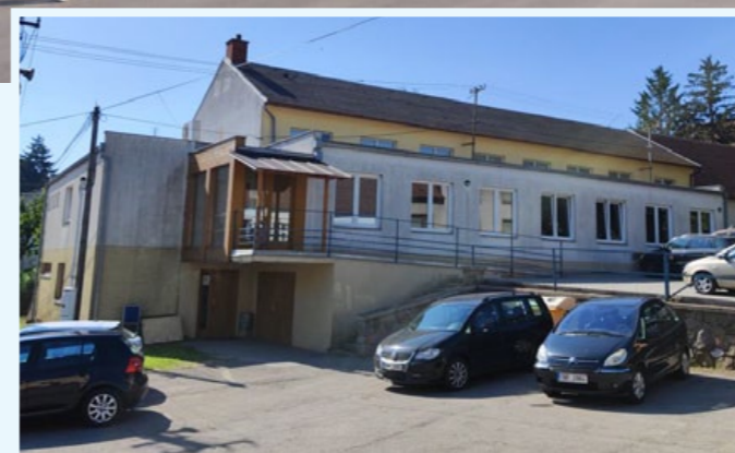
Současný stav Kulturního domu.

Projekt modernizace zahrnuje kompletní rekonstrukci vnitřních prostor a nově navrženou přístavbu, která poskytne zázemí pro kroužky, volnočasové aktivity a další komunitní akce. Klíčovým cílem je vytvořit moderní, funkční a esteticky přívětivý prostor, který bude sloužit nejen současné generaci, ale také těm budoucím.