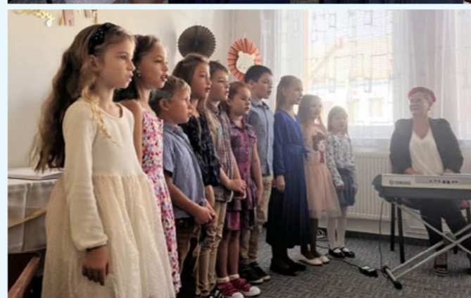
Vítání občánku podzim 2024.