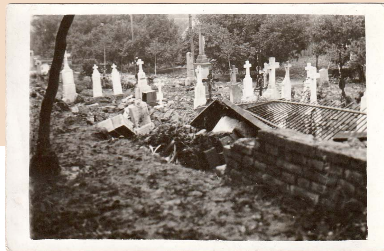
Starý hřbitov 21. 8. 1938 přívaly vody z Novosádů a Starých hor protrhly hřbitovní zeď a vyvrátily pomníky, které roznesly po celém dolním konci. Náklad na opravu hřbitova činil 20 000 Kč mimo soukromé pomníky.

V souvislosti se hřbitovem nám ještě zůstává osoba dosti důležitá - hrobník. Tedy ten, který musel ručně vy-